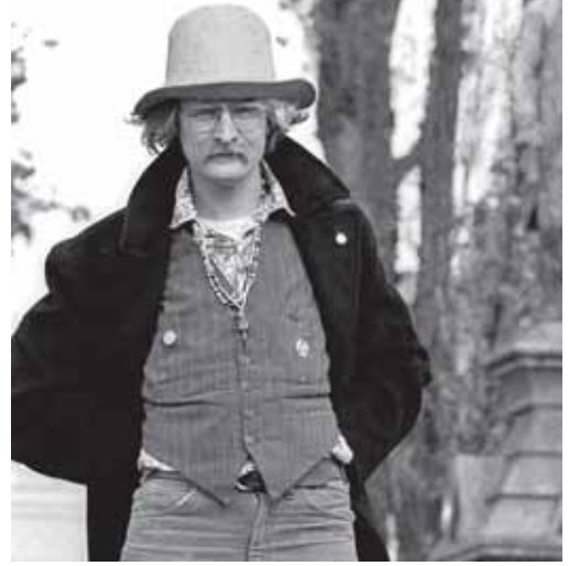
Çeviren: Ozan Çororo

Richard Brautigan kimi eleştirmenlerce Beat kuşağına dahil edilse de münferit biçimde değerlendirilmesi gereken bir yazardır. Romanlarının yanı sıra kısa öykü türünün en iyi örneklerinden biri olan "Scarlati Tilt" öyküsünün de içinde yer aldığı "Revenge of the Lawn" (Çayırların İntikamı) kitabı dikkate değerdir ve henüz Türkçe'ye çevrilmemiştir. Brautigan, Japonya'da yaşadığı sırada haiku sanatından etkilenmiş; ortaya bu geleneksel sanat ile kendi sesini birleştiren "Japonya Günlükleri" adlı eseri çıkmıştır. Okuyacağınız kısa şiirleri de, haiku olmasa da, az sözcükle kurduğu şiirlerindedir.