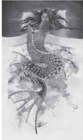
Desen: Oğuz Demir

Yerel bir imdat frekansından yayın yapıyordu kalbimiz Yolun karnındaki karanlık trendeydik