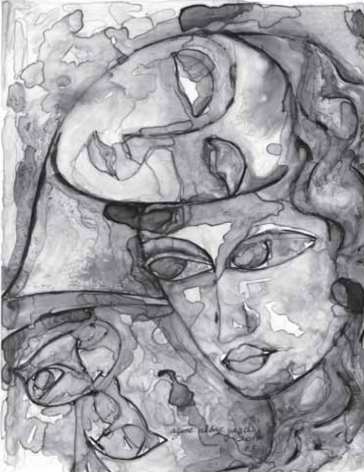
Desen: Azime Akbaş Yazıcı

CazKedisi olarak yeni şeyler öğrendim ve her öğrendiğim şey, beni bir yeni yaşımla büyüttüm. Her yeni yaşım, yeni şiir ve caz kardeşleri taşıdı kalbime. Bundan iki yıl önceydi ve yine bir güzelim İzmir Tuypa günüydü , gözlerimi açtığımda yeryüzüne. Üçüncü kez şiir ve caz aşkına yüzüm suya dokundu. Koruluklardan ve ebemkuşağının altından geçerken, kocaman ve hırslı kediler beni küçümsediler. Küçümsediler, haklılar elbette. Çünkü benim minicik patilerim ve küçücük kirpiklerim vardı kimseyle kavga etmeyen. Onlar, büyük harflerle bağırıyorlardı aynalarına. Bense sımsıcak hayallerimi yeni aşklara açıyordum siyah beyaz bir cazın içten dokunuşuyla.