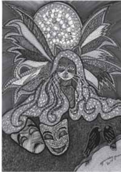
Desen: Oğuz Demir

Sardunya kadınları soyunur Çekilip dizelere savurur karanlığı.