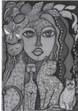
Desen: Oğuz Demir

İlkyazın yağmuruyla canlanan solgun yüzü değil sadece bahçenin kim varsa affetmenin erdemiyle cezalandırıp, arındım.