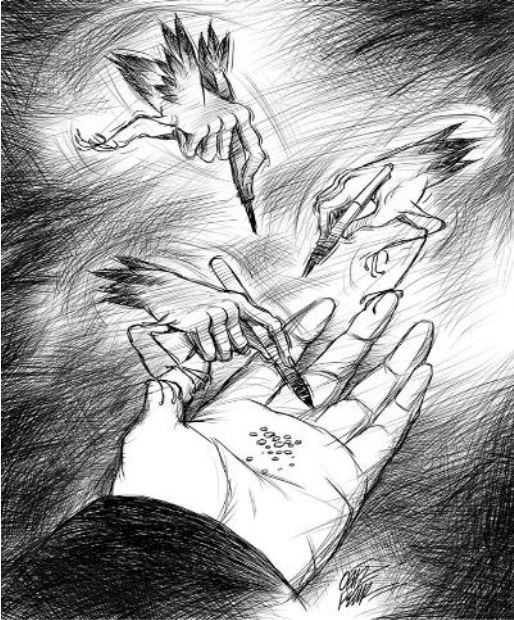
desen: oğuz demir