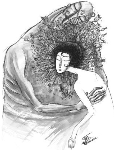
desen: oğuz demir

ağır çıktım basamakları gök yere düştü deniz tepede her yer aynı sen ayna baktıkça gözlerine parlak bir güvercin dünden razı gitmeye